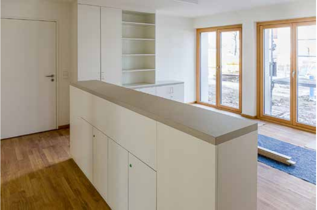
Oben: 17. Februar 2020 Fast fertig zum Einräumen: Das neue Pfarrbüro. Unten: 23. Januar 2020 Mit zum Aufwändigsten gehört die neue Lüftungsanlage des Pfarrsaals