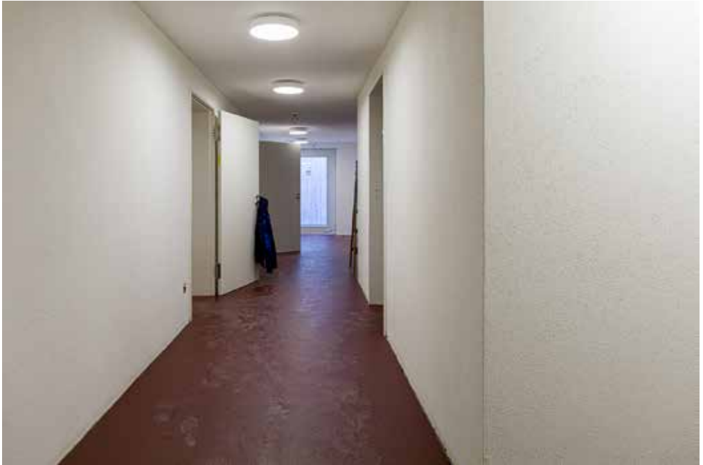
Oben: 20. Januar 2020 Links geht es zu den neuen Toilettenanlagen im Keller. Unten: 6. März 2020 Es fehlen nur noch die schallschluckenden Platten an der Decke