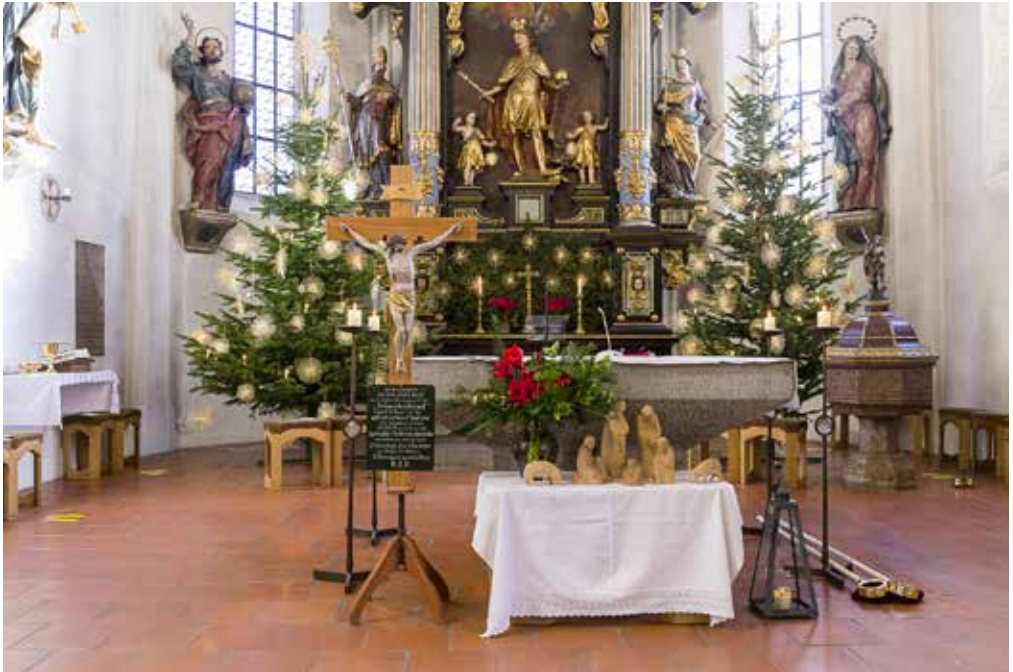
oben: Sebastianitag in St. Quirin, heuer zum ersten Mal seit langer Zeit ohne Fahnenabordnungen unten: Faschingsgottesdienst für Senioren in St. Quirin