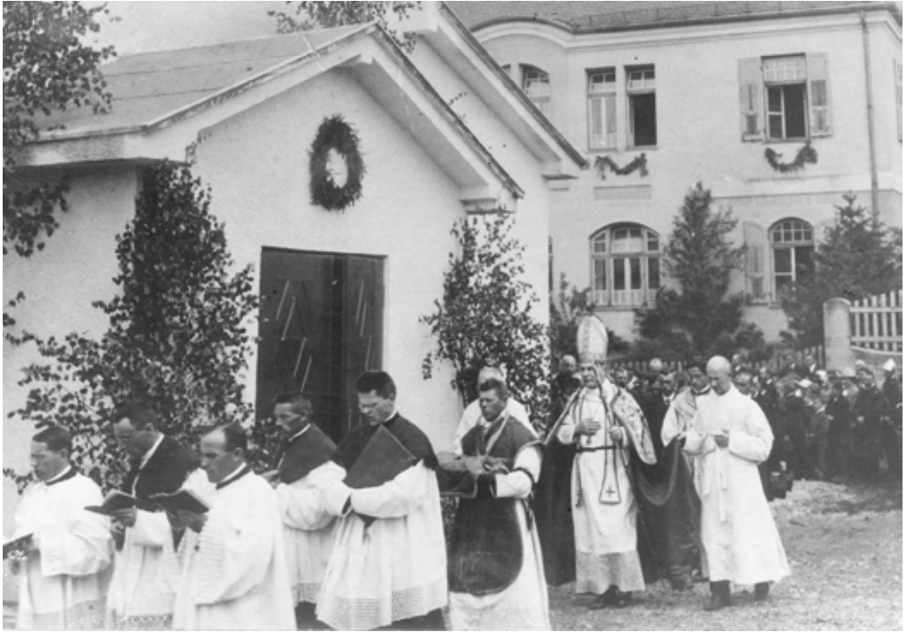
Kardinal Faulhaber (2. von rechts) weiht am 29. April 1921 die erste Kirche Neuaubings ein. Im Hintergrund sieht man die heutige Limesschule.

ihr Gebet den Segen Gottes für die Mission erleben“. Weitere Veranstaltungen gibt es für Frauen und Jungfrauen (das sind alle Mädchen, die nicht mehr die Schule besuchen) und zuletzt, am arbeitsfreien Sonntag, für die Männer.