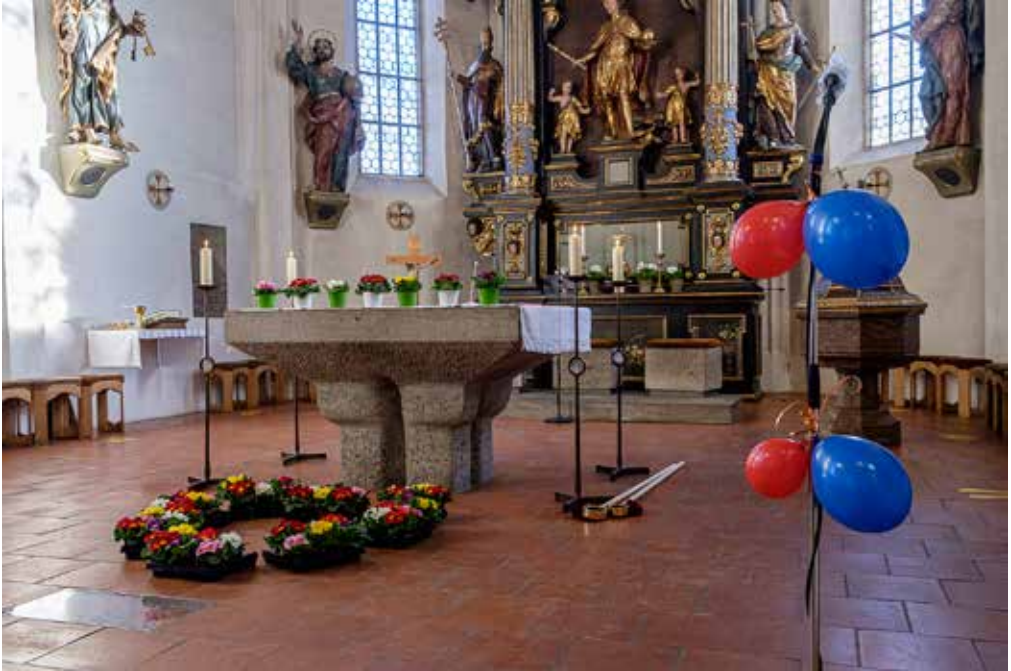
oben: Liebevolle Dekoration am Faschingssonntag in St. Quirin unten: Diese Jugendlichen aus dem Pfarrverband wurden im Februar von P. Abraham gefirmt