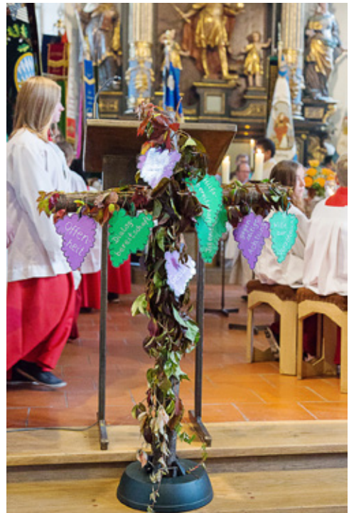
Kreuz geschmückt mit Weintrauben und wichtigen Voraussetzungen für ein Gelingen des Pfarrverbands, der vor 10 Jahren gegründet wurde