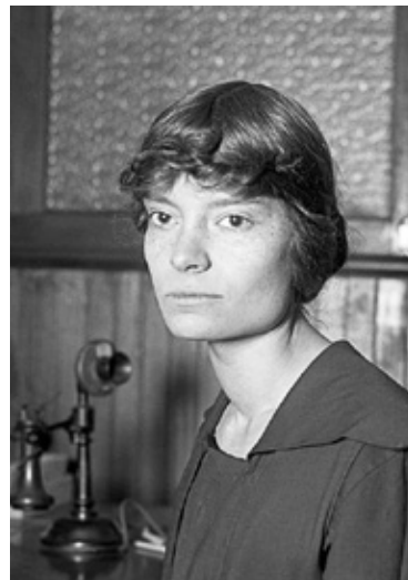
Dorothy Day 1916

in Los Angeles gewann Dorothys Brüder als Mitglieder des Kirchenchors. Dorothy fand Gefallen an der Liturgie und den Gesängen. 1911 empfing sie in dieser Kirche Taufe und Konfirmation.