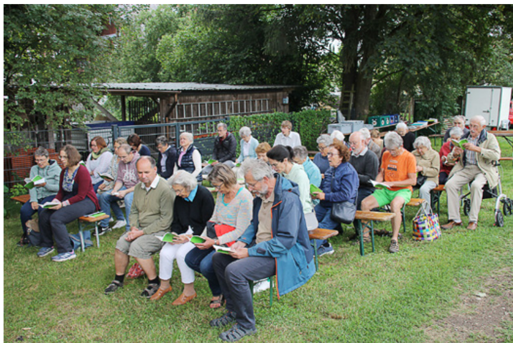
Oben: Pfarrverbandsgottesdienst am 14.7.2024 an der Altostraße Unten: Stadtteiggottesdienst in St. Michael am 2.8.2024