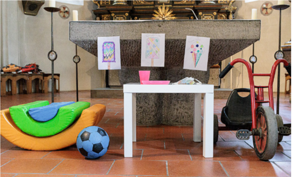
Verabschiedung der Kindergartenkinder in den neuen Abschnitt der Schulzeit