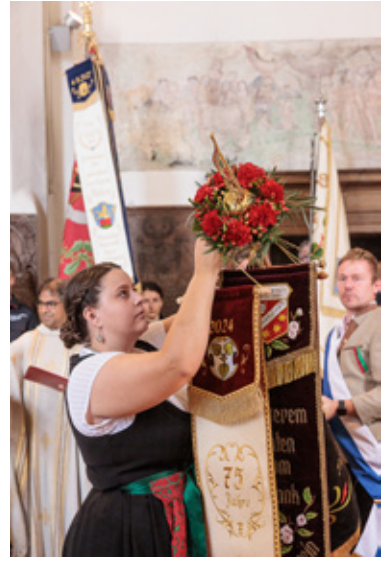
75 Jahre Neuaubinger Volksbühne: Festgottesdienst in St. Quirin am 20.7.2024. Oben: Die Vereinsfahne erhält ein Festband zum Jubiläum. Unten: Sehr gut gefüllt war die Pfarrkirche beim Gottesdienst