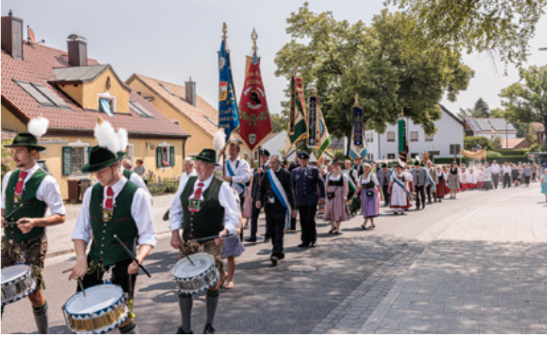
Früchte des Pfarrverbands oben: Abwechselnde Feier des Fronleichnamfestes (hier 2023 in St. Quirin), Mitte: Die Mitglieder des Pfarrverbandsrats nach der Wahl 2022, unten: Der gemeinsame Weihnachtsbasar, hier 2018 in St. Michael