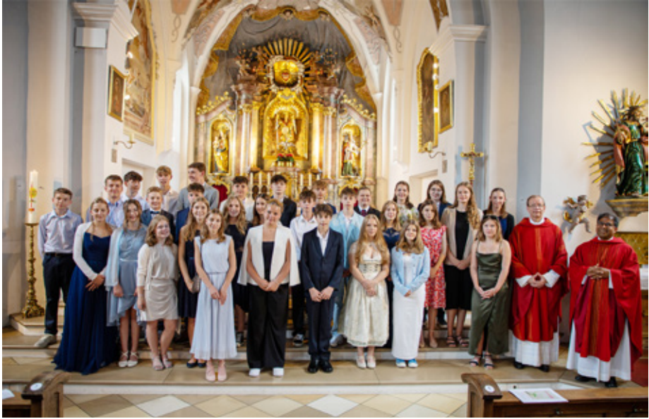
Firmspendungen in St.Michael (oben) und St. Quirin (unten) am 6.7.2024