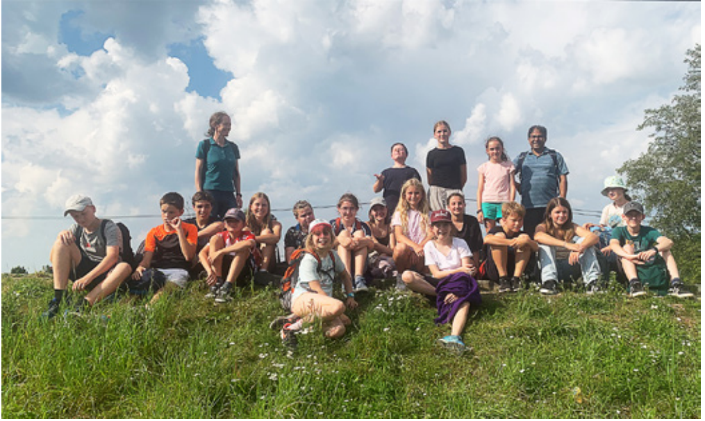
Ausflug der Ministrantinnen und Ministranten von St. Michael und St. Quirin am 20.7.2024 in den Skylinepark