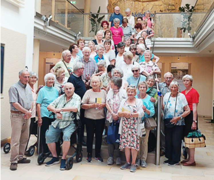
Oben: Seniorenausflug von St. Michael am 18.6.2024 nach Adelholzen und Siegsdorf Unten: Bücherflohmarkt in St. Michael