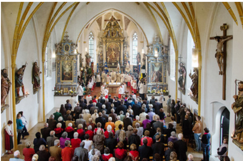
Gottesdienst zur Gründung der Pfarrverbands im Herbst 2014 in St. Quirin