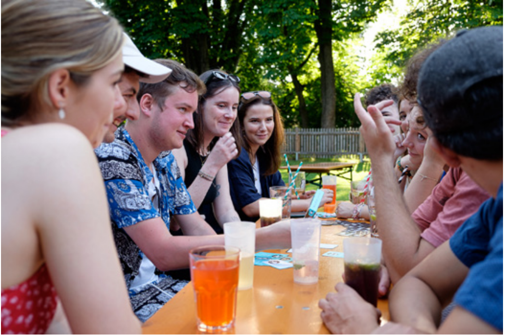
Generationensommerfest am 27.7.2024 in St. Quirin