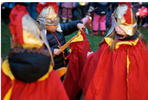
Linke Seite: Martinsfeier im Kindergarten von St. Quirin Rechte Seite: So feierten die Kinder in St. Michael