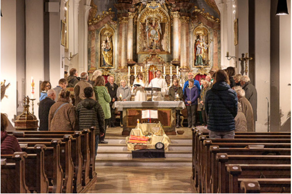
Mit einem Gottesdienst in St. Michael und einer anschließenden Feier im Pfarrheim beginnen am 12. Oktober 2024 Ehepaare aus Lochhausen und Aubing ein rundes oder halbrundes Ehejubiläum.