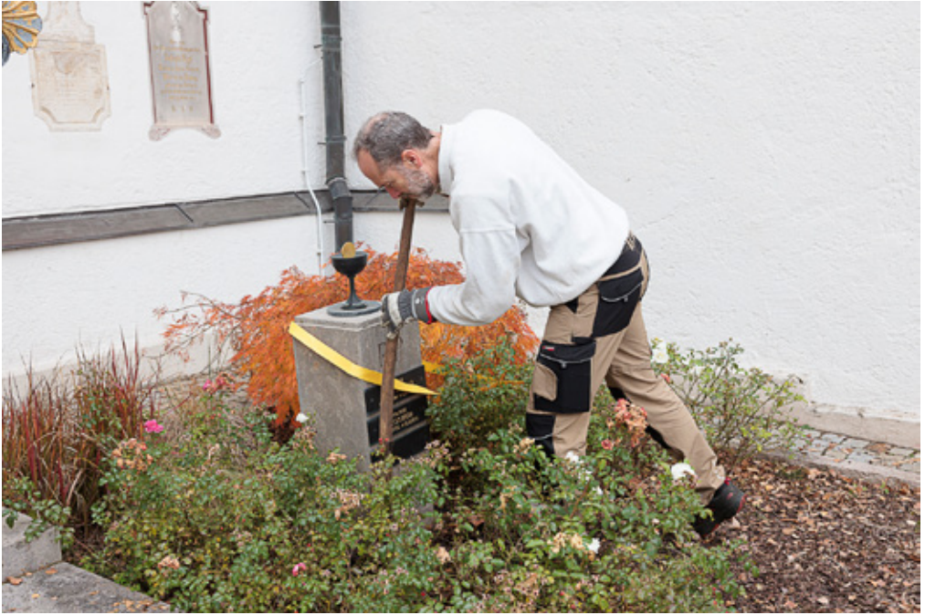
oben: Aktionstag in St. Quirin; unten: Patroziniumsgottesdienst in St. Michael