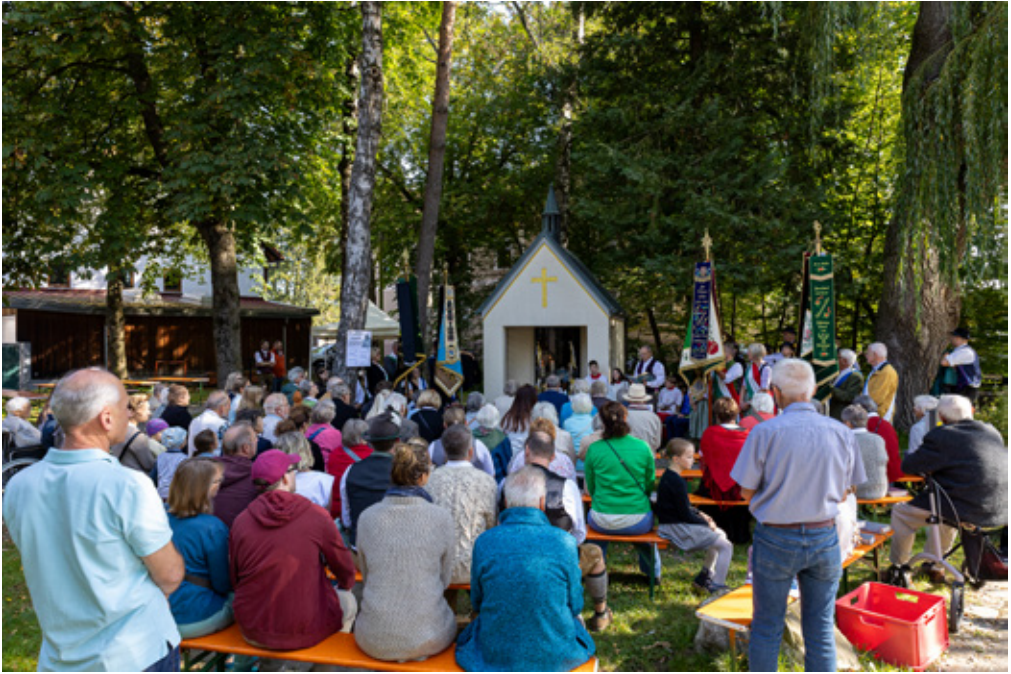
oben: 60 Jahre Marienkapelle Langwied; unten: Erntedank in St. Michael